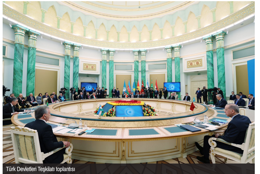
Türk Devletleri Teşkilatı toplantısı