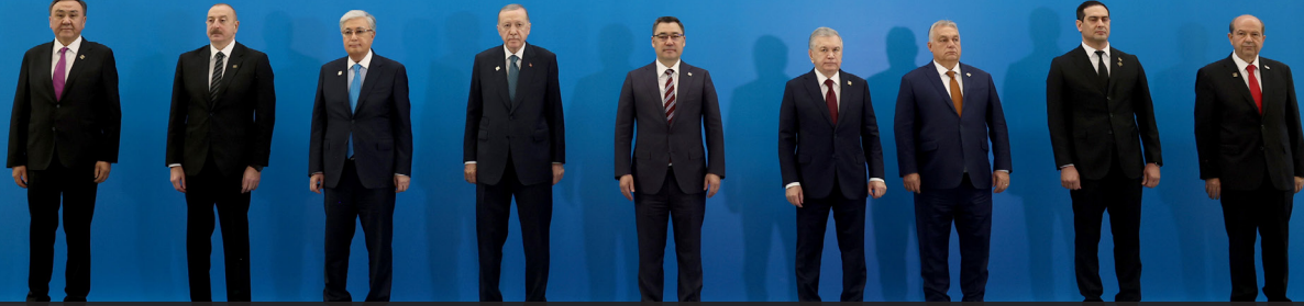
Türk Devletleri Teşkilatı 11. Devlet ve Hükümet Başkanları Zirvesi

“Ortak kimlik, birlikte hareket edebilme kabiliyeti ve eşsiz potansiyeli ile uluslararası sisteme etki edebilecek bölgesel bir güç konumunda olan Türk Devletleri Teşkilatı, ihmal edilen insanlığın yeni değerler ışığında var olma vadinin sahibi, savaşa ve kaosa mecbur bırakılan dünyanın adil ve müreffeh gelecek umududur.”