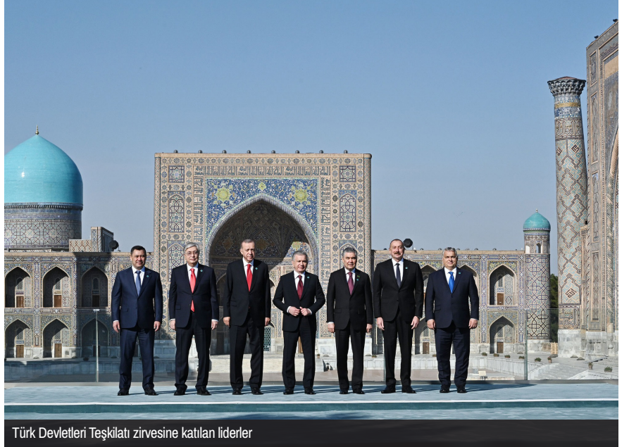
Türk Devletleri Teşkilatı zirvesine katılan liderler

Teşkilatın, uluslararası bir örgüt için kısa sayılabilecek faaliyet dönemine rağmen, kuruluşundan bugüne kadar geçen 15 yıllık süreçte elde ettiği değerli kazanımlar ise program içinde ortaya konuyor: Türk Yatırım Fonu, Türk Dünyası 2040 Vizyonu, Ortak Sanayi ve Ticaret Odası, Hazar Geçişli Orta Koridoru geliştirmek üzere Kardeş Limanlar Projesi, Uluslararası Kombine Yük Taşımacılığı Anlaşması, Basitleştirilmiş Gümrük Koridoru Anlaşması, E - permit uygulaması,