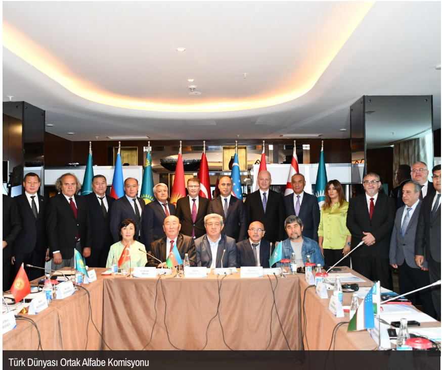
Türk Dünyası Ortak Alfabe Komisyonu

Ayrıca yapım; 300 milyonluk nüfusu, 4,5 milyon kilometrekare coğrafyası, yaklaşık 2 trilyon dolarlık ekonomik potansiyeli, dünya düzeninde etkili bir aktör olma gücüyle kısıtlı zamanda büyük başarıları imza atan TDT'nin, Cumhurbaşkanı Recep